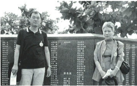
平和の礎～群馬県出身者の慰霊碑の前で～

国内唯一の地上戦の舞台に残る生々しい傷跡、今なお国内の米軍施設の70%が集中する現実…沖縄では、まだ戦争が終わっていません。「今が平和だから、悲惨な事実を忘れてはならない!」そう強く感じた3日間でした。