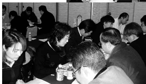
模擬相談を行う参加者