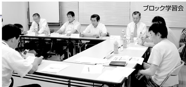
地協ブロック学習会で組織化意見交換(2005年7月)