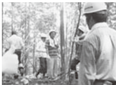
▲草津やすらぎの森整備事業

広域な活動範囲を持つため、活動拠点が偏りがちですが、年間5～6回程度機関紙を発行し、活動紹介や報告、取り組みへの参加募集を行い、組合員に向けて活動の周知を行っています。