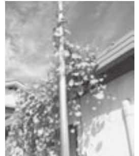
ヘブンリーブルーのグリーンカーテン

庭付き一戸建ての宿命（?!）か、駐車場の草取りは欠かせませんが、春は東吾妻町特産の水仙、夏はゴーヤや朝顔を植えてグリーンカーテンを作るなど、事務所からもエコを発信しています。