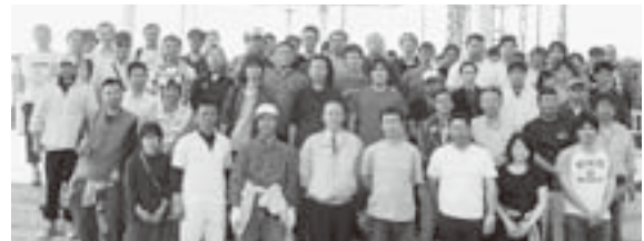
フェスティバルで結集！加盟組合の皆さんと

球観戦、クリーンキャンペーンは花火大会の翌朝のゴミ拾いを実施。連合活動・組合活動の理解・浸透を図っています。