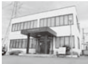
伊勢崎市勤労者会館

東武線新伊勢崎駅のすぐ南にある伊勢崎市勤労者会館の中に事務所があります。会館内には、幹事会だけでなく各種団体が利用する会議室などがあります。静かな住宅街ですが、線路脇に建っているので電車が通ると結構揺れます。