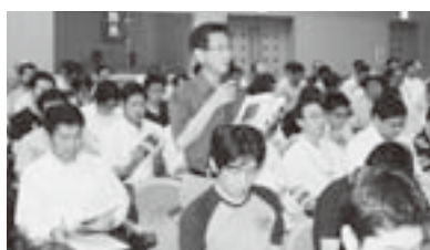
昨年の意見交換の様子

政策フォーラムでは、組合員・県民の皆様からご協力いただいた2012年県民意識調査の分析結果および、2013年度政策・制度要求と提言の考え方について報告します。