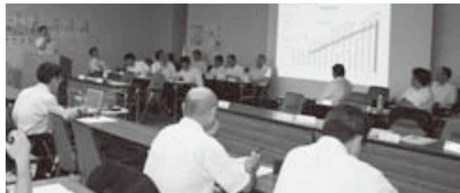
各地協の取り組みの特徴点に聞き入る参加者

総括会議では、子ども向けの催しである戦隊もののキャラクターショーや「ふあふあ」などのエア遊具の費用面に対する意見交換や、労働組合の活動を地域住民に理解してもらう取り組みを強化していくことを共有しました。