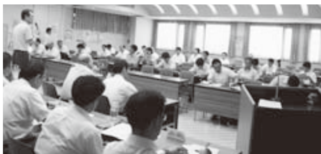
各地協から参加を得て総括会議を開催

今年のフェスティバルは、天候にも恵まれ昨年を上回る51,800名の来場を得ることができました。開催日には幅を持たせ、3週に亘り開催されました。