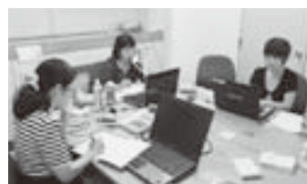
キャンペーン時は3名で対応

相談内容は「パワハラや嫌がらせを受けて精神的不安になった」、「やる気が出ない」などの健康問題(30%)が最も多く、「ハローワークに行ってもなかなか仕事が見つからない」など就職に関すること(22%)、「職場の方針や雰囲気になじめない」など、