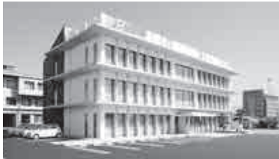
これまでの敷地に新会館建設。1階に共済ショップ前橋店を併設