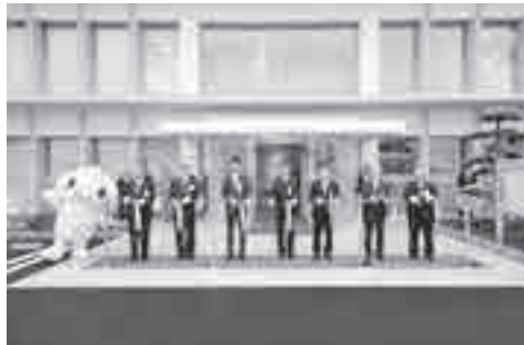
新会館玄関前でテープカット